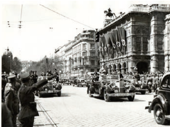
Takhle to vypadalo: Hitlerova kolona projíždí kolem Vídeňské státní opery.