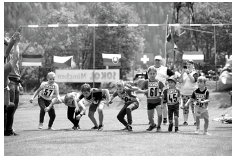
Start a... cíl.

Po odovzdávaní cien nám zbor Sokol Praha na gitarách zahral a zaspieval táborácke pesničky. Do hlbokej noci nás opäť zabávali púšťaním známych melódii bratia Zdeněk a Standa z Viedne. Pondelok, posledný deň stretnutia, sa