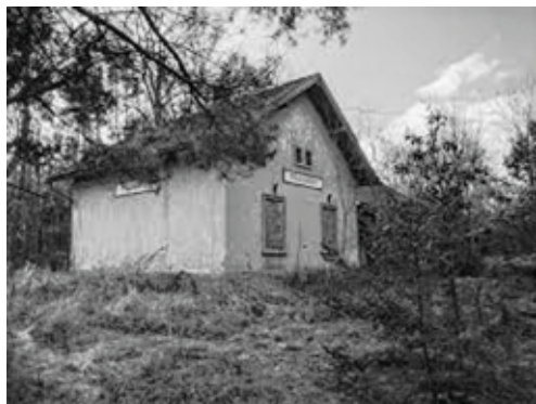
Tady by vlak zastavil jen na znamení, jestli vůbec. Facebook

jestli jsou opravdu na místě jejich určení. Řidič řekl, že ano. Sejděte po cestě dolů, a jste ve vsi. Já tam s autobusem nemůžu sjet a zastávka je tady. Jaroslava se ohlédla po ostatních cestujících. Dívali se po nich se zjevným zájmem a zůstávali sedět na svých místech.