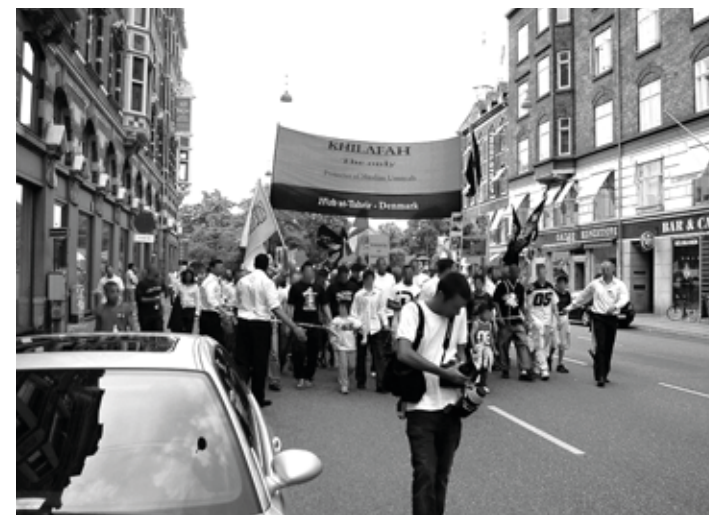
Už v roce 2006 demonstrovali muslimové v Kodani za zřízení kalifátu.