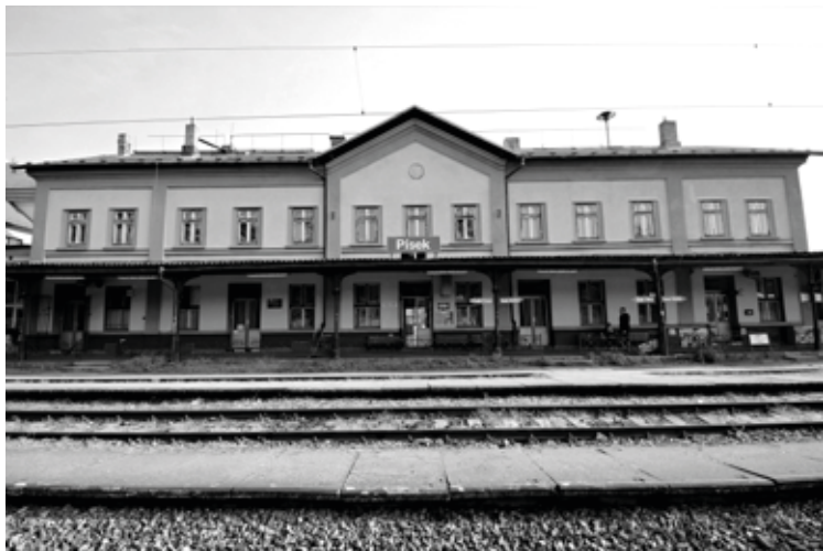
Písecké nádraží. cd.cz

Během tohoto času, času výroby kladiva, se odehrálo několik událostí, které zásadně ovlivnily Janův život, i život všech členů jeho rodiny.