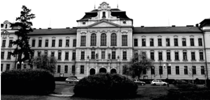
Z mladoboleslavského gymnázia (dříve SVVŠ)...