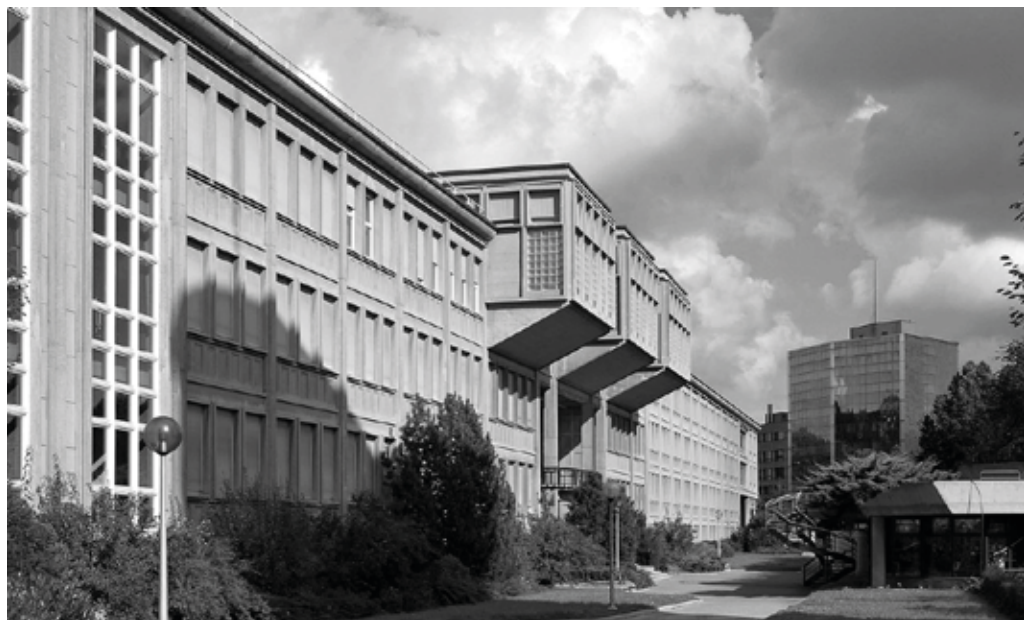
...na univerzitu ve švýcarském Fribourgu.

Naštěstí jsem se později, po srpnové invazi, dostal do Švýcarska, kde jsem byl na univerzitu přijat i bez korupce. ToM